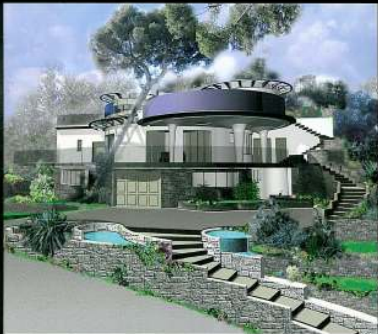
On this page The studying of the Villa - French Neoclassical Mediterranean Villa - Dig Ferris, France